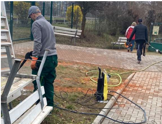
- ein 3-fach Hoch der Sauberkeit -

nun können wir die Tage schon zählen bis die müden Knochen wieder über die Sandplätze wirbeln. Die Platzbaufirma und natürlich viele engagierte Freiwillige haben in den letzten Wochen gute Arbeit geleistet, so dass die Freiluftsaison planmäßig am 13.04.2026 starten sollte.