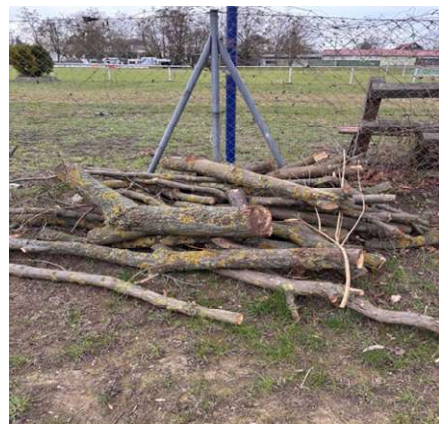
- diese Äste schmeißen kein Laub mehr ab -

Bei unseren ersten Einsätzen wurden so mancher Eichbaum und manche Hecke von fabelhaftem Feuer- / Kaminholz befreit, das nun einen dankbaren Abnehmer sucht. Hierfür starten wir eine kleine Osterauktion: